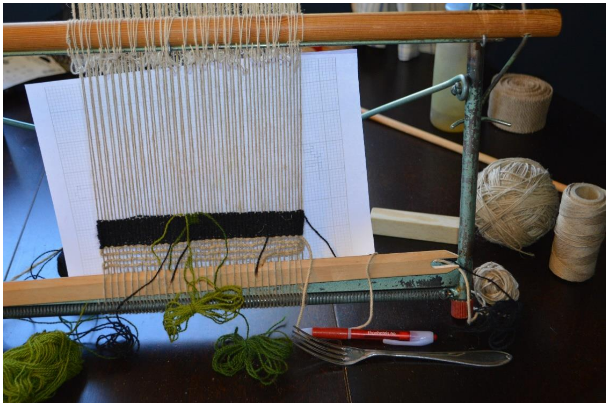
Start på veving.