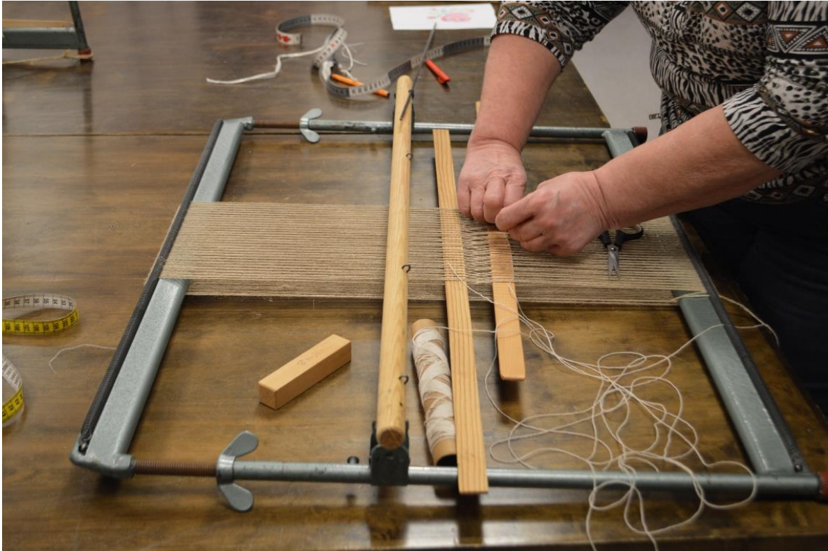
Påsetting av renning, og hovling av veven for de som hadde skilleapparat.