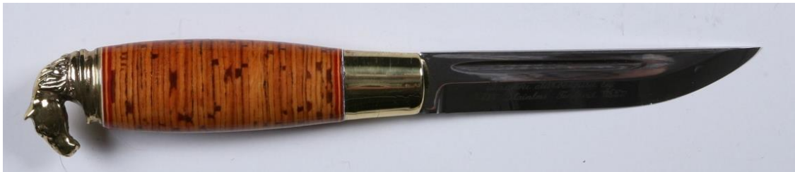
Finsk kniv laget av Iisakki Järvenpää Oy. Gamle Bergen Museum

Prosjektet ble foreslått fra et styremedlem og tatt opp på styremøte til diskusjon og ble vedtatt.