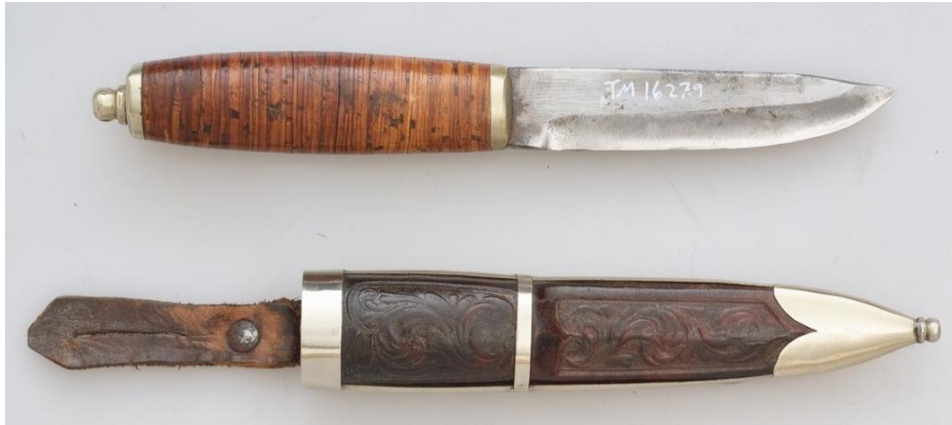
Kniv med initialer PT mulig Peder Lerud på Taasaas. Mjøsmuseet