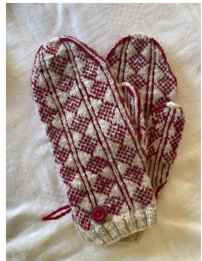
Damevott, Størrelsen er symmetrisk med 6 diamantkolonner