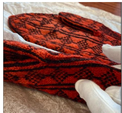
Detaljer N1236