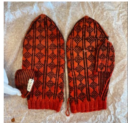
Bilde av N1236

Votten har en kile hvor det strikkes røde og svarte linjer. Det økes annenhver omgang 8 ganger, og hver omgang, 7 ganger. På selbuvotter med kile økes det ofte på begge sider av kilen, men på denne votten økes det bare på yttersiden. Det gir en veldig god passform. Denne typen kile er kjent fra oppskrifter på svenske tvebandsvotter. To av de sorte linjene fra kilen fortsetter opp på utsiden av tommelen, som et skille mellom to kolonner diamanter. Innsiden av tommelen har linjer som på kilen. Fellingen på begge tomlene er gjort slik at tommelens høyre kant har dobbel vertikal linje slik hånden på votten har, mens tommelens venstre kant har felling med enkel vertikal linje. Også tomlene avsluttes med tre omganger i bunnfargen.