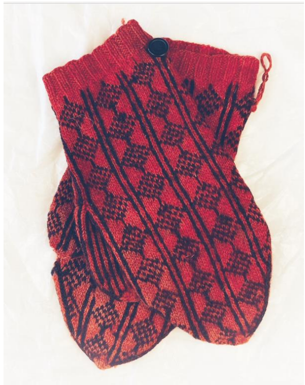
Vottene på museet, N1236.

Vi gikk grundig til verks på første besøk på Tromsø Museum. Vi tok mål, vurderte strikkefasthet og så etter detaljer. Og vi tok mange bilder!