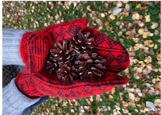
Museets svarte diamanter, herrestørrelse

Mønsteret er beskrevet med original-, dame- og herrestørrelse.