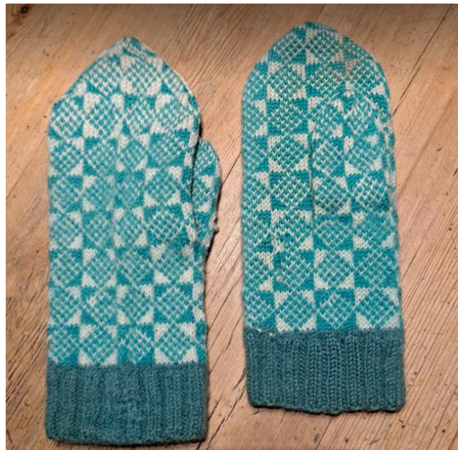
Troligen fra 50/60-tallet byn Porsj vid Lule älv.

Jag tycker mig ha sett liknande mönster runt hela Östersjön: på finska sidan och i de baltiska staterna inte minst.