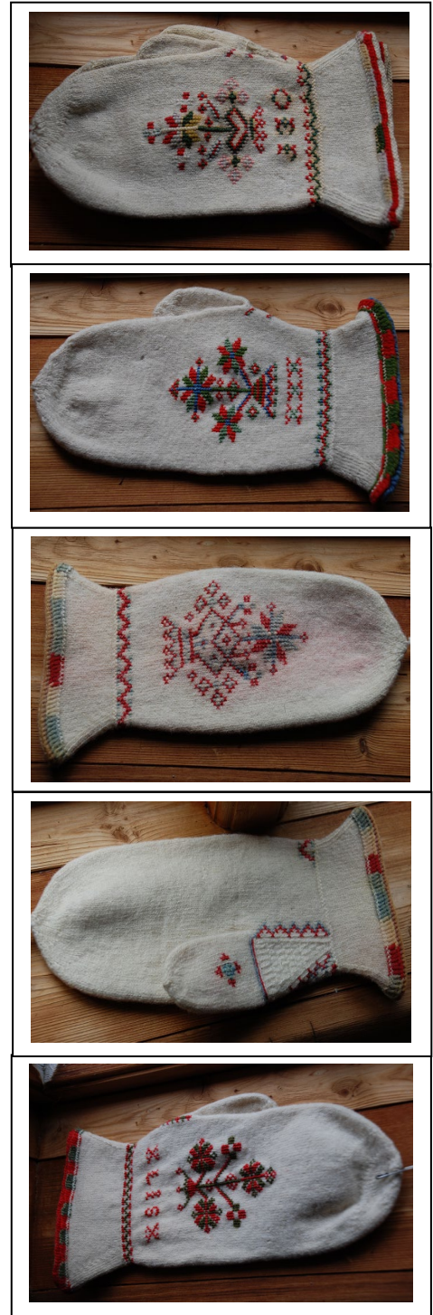
Et utvalg av tradisjonelle votter fra Sunndal

Noen av vottene på Leikvin hadde betegnelsen «bryllaupsvott» eller «kyrkjevott,» og de hadde lite slitasje. Mest sannsynlig var vottene stasplagg som bare ble brukt til fest og høytid. Vi valgte å kalle votten vår for Stasvott fra Sunndal.