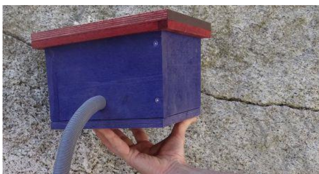
8. Slik ser det ferdige hotellet ut.