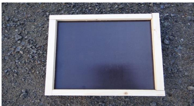
6. Tak: Listene skrues fast til takplata med to skruer i hver list. Taket legges løst oppå hotellet til slutt. Legg gjerne på en stein på toppen.