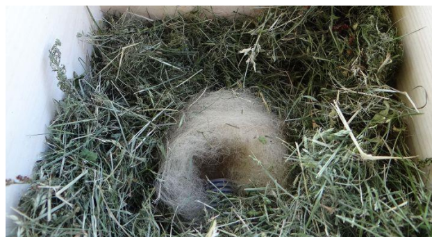
9. Isolering: Først legges tørt, mykt gress mot ytterkanten i kassa. Deretter legges de myke materialene i senter av rommet. Her lages ei lita dronningseng. 8. Pass på at det indre hulrommet, bolkammeret skal måle ca 3-4 cm i diameter.