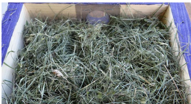
10. Fyll opp resten av kassen med tørt gress.