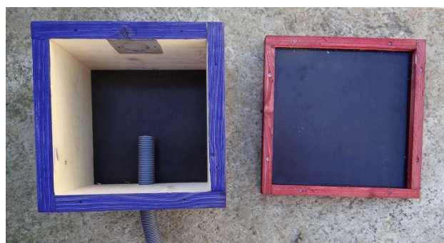
7. Hotellet males utvendig før innredningen kommer på plass.