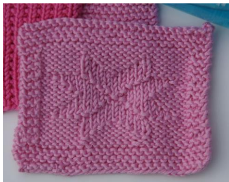
Tegn av mønsteret I den størrelsen du ønsker