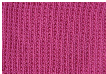
1 rett og 1 vrang