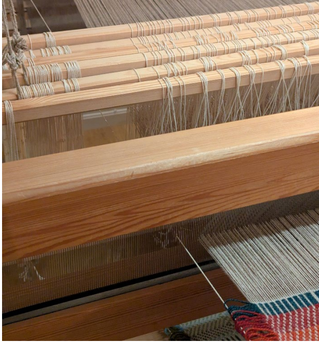
Frynsetråd: Ein uhovla tråd i matterenning tynga ned med eit lodd kan hjelpe for å lage frynser