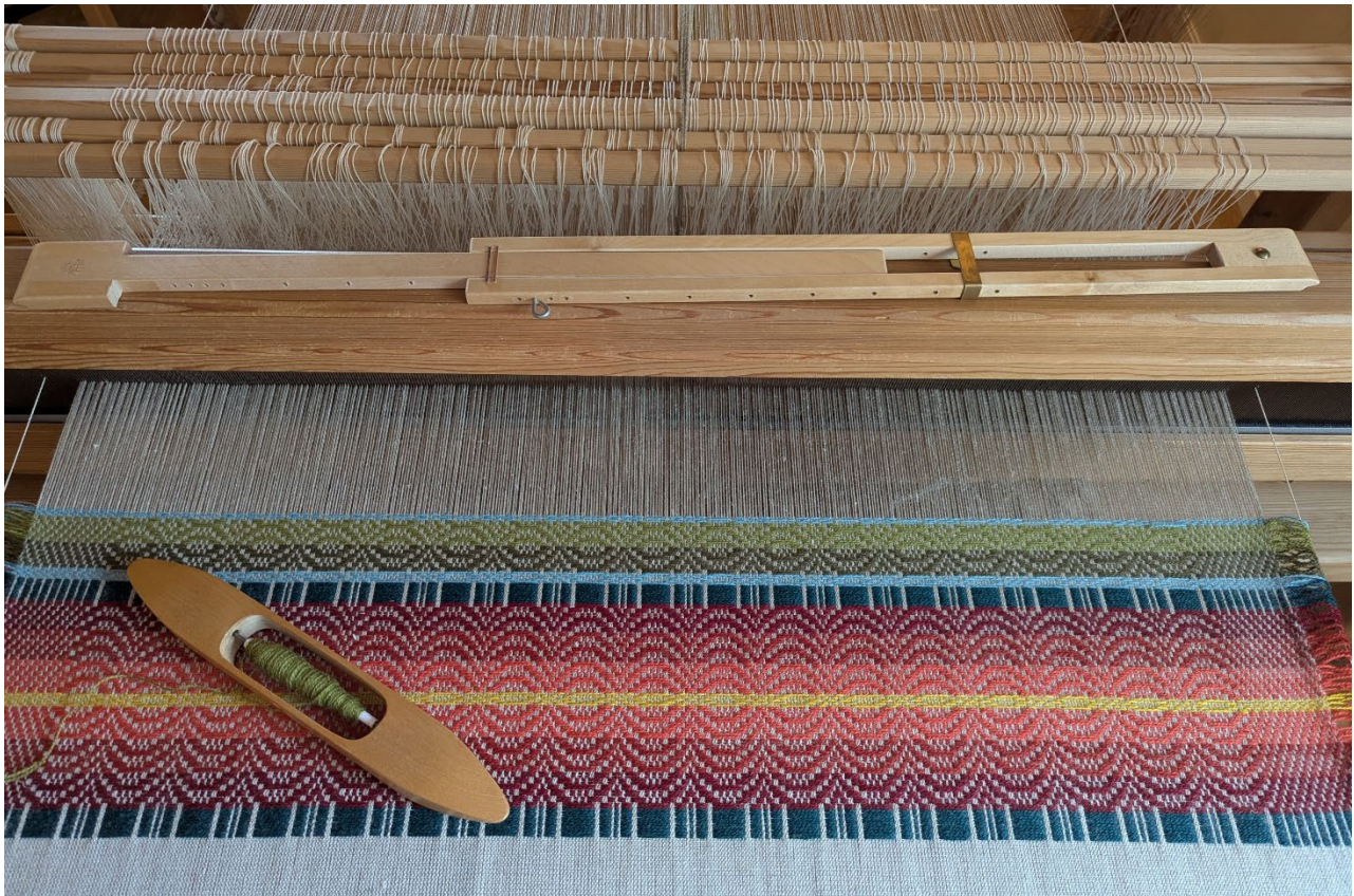
Slik kan eit telemarksteppe sett opp i enkel skilbragd sjå ut. I tillegg til skyttelen med mønsterinnslag treng du ein skyttel til fylt med tråd av lin for å binde botnbindinga.