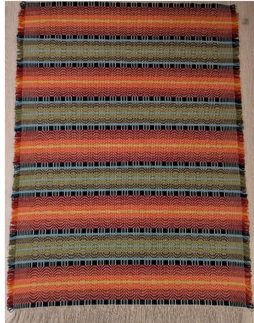
Eit telemarksteppe vove med oppsett i enkel skilbragd